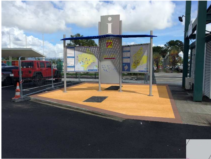
Photomontage d'un mobilier dans son environnement